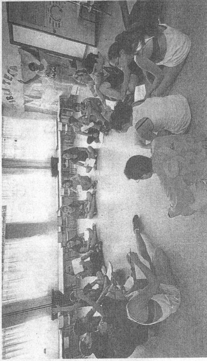
Algunos de los participantes más mayores realizan una dinámica grupal junto a una monitora.